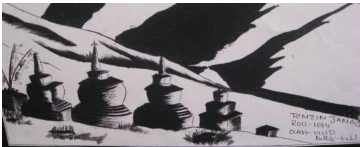
© Dessin d'enfant tibétain, école de Patlikuhl (Inde)

- L'organisation est un peu différente, c'est la SLF (Snow Lion Foundation) , qui gère les parrainages AET. Créée en 1972 par l'Agence suisse pour le développement et la coopération, la SLF a été officiellement enregistrée par le gouvernement népalais comme organisation chargée de l'éducation, de la santé et de la solidarité des réfugiés tibétains vivant dans les camps de ce pays. AET parraine aussi de nombreux élèves, étudiants et personnes âgées au Népal.