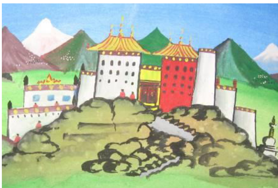
© Dessin d'enfant tibétain, école de Patlikuhl (Inde)