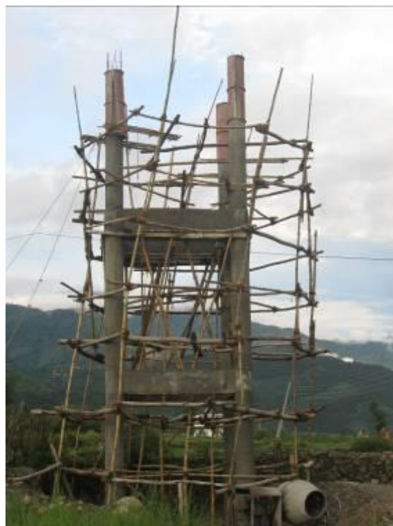
Réservoir de la Maison de retraite de Chauntra.

Plusieurs administrateurs vont régulièrement en Inde et au Népal, à leurs frais, bien entendu !