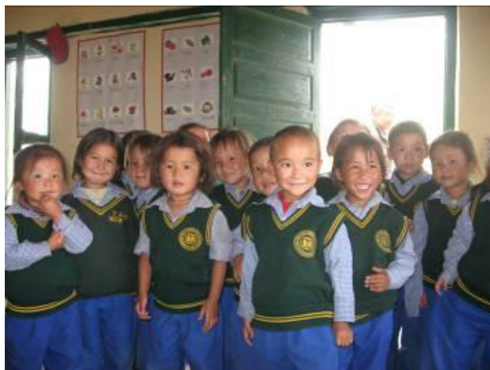
© Martine Giraudon. Classe maternelle TCV au Ladakh (Inde).

Depuis le 17 septembre 2009, l'AET a reçu également l'agrément du Comité de la Charte , qui fait l'objet d'un renouvellement régulier tous les trois ans et garantit la transparence financière et la bonne gouvernance des associations faisant appel à la générosité du public.