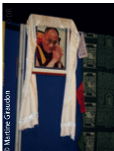
La sourire précieux de Sa Sainteté.