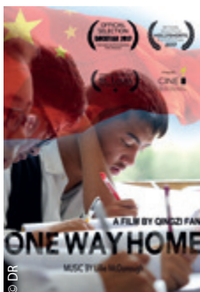
L'affiche de One Way Home de Qingzi Fan.