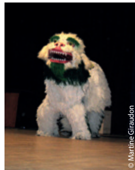
Le Lion des neiges a beaucoup plu aux petits enfants !