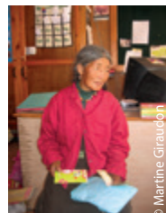
Nos personnes âgées sont la Mémoire du Tibet.