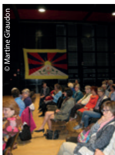
Un public qui a réussi à braver les grèves.