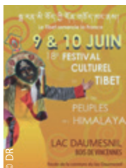
La nouvelle affiche du Festival des Himalayas.