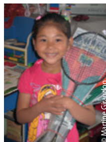
Parée pour nous battre au badminton.