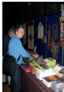
Les premiers parrains entrés dans la Salle stand et restauration.