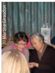
Le soir au restaurant, Marie-Agnès a droit de ses explications !