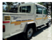
Merci de la part de la Maison des Personnes âgées de Chauitra