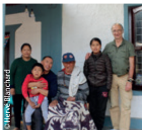
La petite famille avec son Parrain !