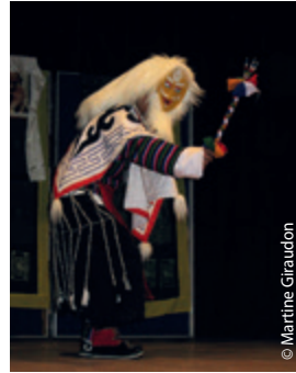
Tashi shôpa ou le chant de la bonne Fortune...