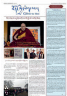
Page du Courrier du Tibet, tout jeune mensuel franco-tibétain.