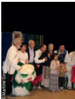
© Martine Giraudon Tous en scène, un final pour le moins joyeux!