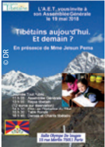
Merci au Finistère pour le superbe flyer de l'AG du 19 mai (DR 29).