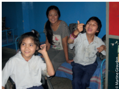
Les deux copines en plein joyeux délire !