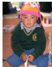
Moi j'suis tout p'tit et j'veux aller faire pipi...

Le Conseil d'administration du 18 avril 2018 a voté un transfert de 9 500 € pour cette école TCV d'excellence près de Dehradun, car L'Inde souhaite que les écoles jouissent d'une autonomie et fabriquent leur propre électricité « verte ». Leur facture électrique devrait être considérablement réduite.