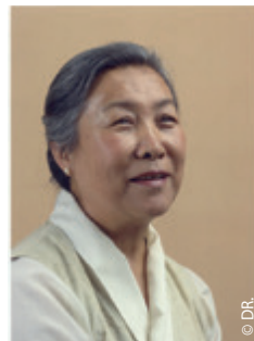
Jetsun Pema, membre d'honneur de l'AET.

Pour participer, accompagnez vos dons de la mention Campagne AET en faveur de la Ngoenga School . Ils seront ainsi clairement identifiés quant à leur objet. Les besoins de ces écoliers méritent toute notre attention, nécessitant un matériel spécialisé, ainsi que de longs soins permanents et coûteux. Nous espérons par cet appel à la générosité toucher aussi bien les parrains que des donateurs extérieurs, qui trouveront là l'occasion de faire un geste utile pour les Tibétains. Merci à vous tous de relayer cette campagne !