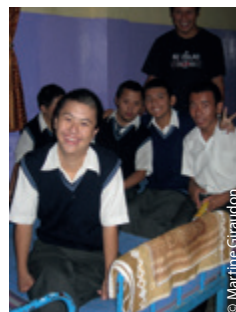
Qu'est-ce qu'on attend pour être heureux ?