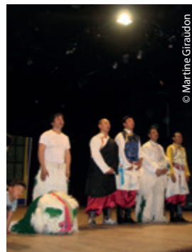
L'Hymne national, devant la salle debout.