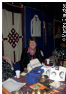
Ouf ! Quel travail ! Le stand est enfin prêt !

Les Jeux olympiques d'hiver sont effectivement prévus à Pékin (et pas au Tibet). La Chine ne s'occupe plus guère des Tibétains, considérant que leurs revendications correspondent à une demande d'indépendance ! Que des associations se mobilisent en 2022 pour un Tibet qui n'est plus d'actualité est une vraie question.