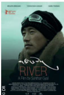
Une des affiches de River de Sonthar Gyal.