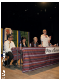
L'ouverture de l'AG du 19 mai 2018.