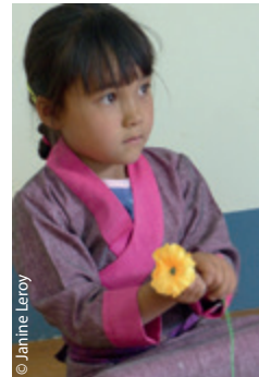
Aider les Enfants du Tibet, une bien jolie page 32 de Tibet, mon rêve.