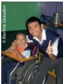
Nos chers écoliers de la Ngoenga School (DR 29).