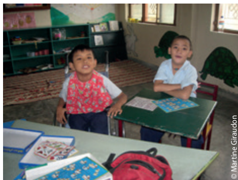
Une salle de classe confortable et adaptée.