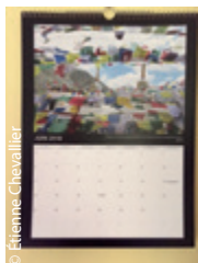
Une page du très beau calendrier proposé aux parrains.