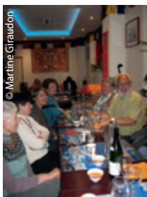
Un repas tibétain inoubliable.