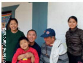
Portait de groupe.