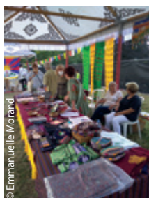
Un stand AET accueillant et bien vivant.