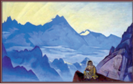
(Peinture de Nicholas Roerich)