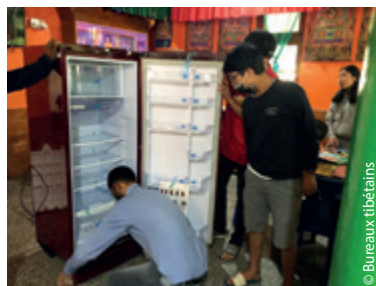
Trop beau, le nouveau frigo !!!!