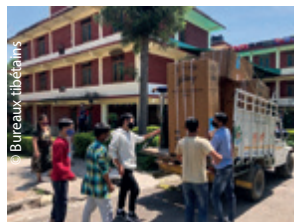
L'arrivée des 11 frigos à TCV Chauntra.

Le CA du 19 juin 2021 a validé enfin deux projets, en lien avec la pandémie, favorisant le télétravail entre professeurs et élèves pour deux écoles. L'envoi de 1 830 € pour le TCV de Lower Dharamsala (Dharamsala-le-Bas) permettra d'acheter 4 ordinateurs portables pour aider dans leur travail 122 élèves et leurs professeurs. L'envoi de 7 560 € à TCV Selakui permettra par ailleurs d'acheter 13 tablettes à stylet pour les 386 élèves et 15 ordinateurs portables pour leurs enseignants.