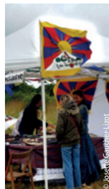
Un stand battu des vents en plein Finistère.