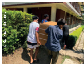
Oh hisse, les garçons !