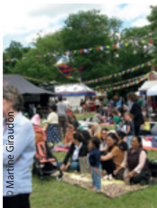
Sauvegarder la culture tibétaine, jusqu'au pique-nique (lingka) traditionnel, ici à la Pagode de Vincennes.

Nous rencontrons plus souvent maintenant de jeunes Tibétains réfugiés en France. C'est pourquoi nous proposons ce Billet de la Communauté Tibétaine de France (CTF), rédigé par son président pour nous les présenter un peu, ainsi que leurs actions.