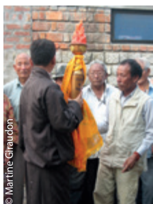
Quant aux Anciens, ils n'oublient jamais le Tibet perdu. Ici, en 2012, les plus valides participaient aux manifestations de la Flamme de la Vérité, pour dénoncer les immolations au Tibet.