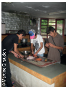
La cuisine, ça les connaît au Lycée professionnel de Selakui !