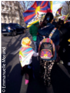
Toujours partants pour le 10 mars, même les plus jeunes !