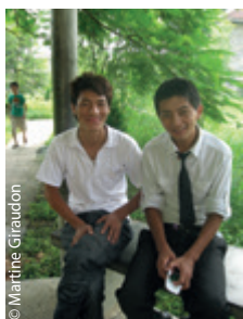
Apprentissage ou université, les jeunes préparent leur avenir.