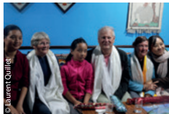
Enfin à Ravangla et chacun avec sa chacune !

Nous visitons une école tenue par un ami indien de Salim et sa femme japonaise. Cette école de 70 élèves ( Prema Netta Orphanes Trust ) ne vit que par des dons et l'aide d'une Brésilienne parlant très bien le français.