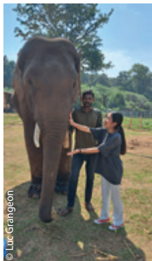
Disket et l'éléphant, près de Bylakuppe.