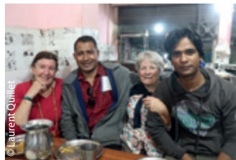
« Des personnes incroyables, qui sont dans le partage de tout. »