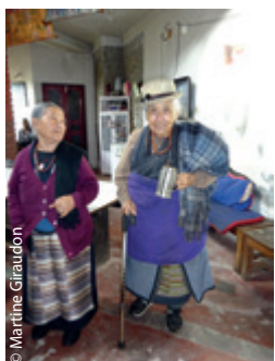
© Martine Giraudon Jeunes du Tibet pleins de zèle ou joyeuses personnes âgées, nous sommes fiers de prendre soin de vous.

Si vous souhaitez vous aussi aider un projet de votre choix, indiquez dans votre courrier celui auquel vous attribuez votre don. Vous recevrez chaque année un reçu fiscal, car les dons de l'AET sont déductibles des impôts à hauteur de 66% dans la limite de 20% du revenu imposable. Merci pour votre indéfectible générosité.