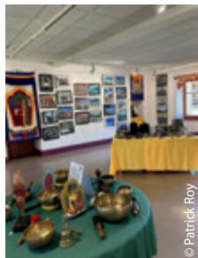
Stand et exposition à Mor- teau, octobre 2022 (DR 25)