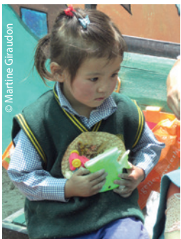
Une toute petite mignonne du Ladakh.

Nourriture, vêtements, soins médicaux leur sont fournis et avec nous ils savent qu'on pense à eux dans des pays lointains. Martine s'amuse d'un coup de fil de parrain, qui entrant lui-même dans la vieillesse, souhaitait parrainer une personne âgée pour ne pas se réengager dans un long parrainage écolier : elle lui a précisé en effet que c'était depuis 1997 qu'elle parrainait le même adorable grand-père tibétain.