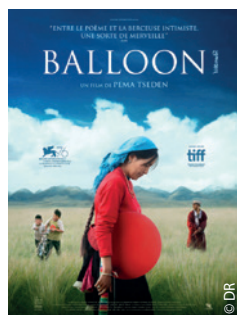
Balloon, distribué par Condor Films, un autre chef-d'œuvre.