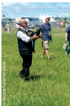
Mais sur terre, c'est le bon vieux joueur de binou.