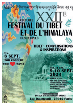
La belle affiche du Festival du Tibet et des Himalayas 2023.

Admirables encore, les Tibétains qui ont dansé sur la pelouse ou le podium en habits traditionnels, chaudement vêtus sous plus de 35° à l'ombre. Les airs sont tellement entraînants que tout le monde se sent obligé de participer, même les dames du stand AET se sont tremoussées ! Et pour la restauration, chacun pense avoir trouvé les meilleurs momos , mais il faut être réaliste, indien, tibétain, tout est excellent.