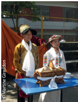
© Martine Giraudon Jour de Fête à TCV Chautra.