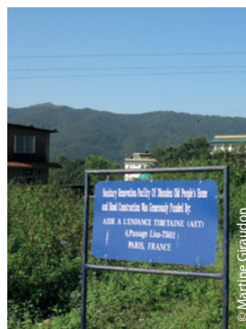
En 42 ans, que de projets financés par la petite association française !

2. Qu'en est-il du parrainage de personnes âgées (deux questions proches) ? Certaines personnes âgées n'ont aucune famille, mais elles ne restent pas seules, des Maisons spécialisées les accueillent de leur mieux pour le meilleur vieillir ensemble possible.