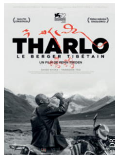
Un magnifique noir et blanc, chez Ed Distribution, ainsi que Jinpa.

Le roman à l'occidental n'était guère d'usage au Tibet, il le devient et c'est bien, car il permet au pays perdu de continuer à rayonner, alors même qu'on y enferme aujourd'hui les petits enfants dans des internats pour en faire des clones chinois. L'AET va continuer de diffuser ce roman, lors de nos Portes ouvertes par exemple. Mais par la Poste, il a le poids de ses 565 pages et vous vaudra 7 € supplémentaires de frais de port.