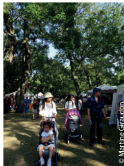
Tibet vivant, une relève assurée un peu partout dans le monde.