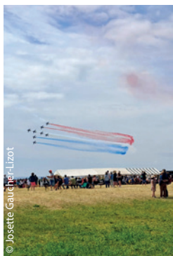
Et voilà la Patrouille de France dans le ciel breton, invitée par l'association Sourire de Mômes (souriredemomes.org).