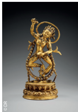
La statuette de Nairatmya, chef-d'œuvre de l'art newari (amisdeguimet.com).