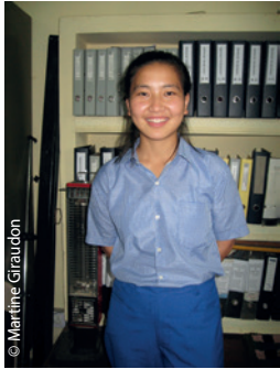
Le beau sourire d'une filleule AET à TCV Dharamsala.