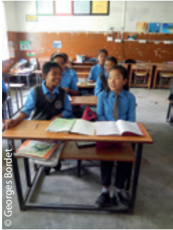
Écoliers studieux de la colonie de Hunsur.