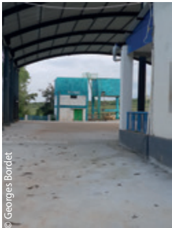
Une petite entreprise laitière à Hunsur.

Dès que l'on quitte la colonie tibétaine et que l'on retraverse les villages indiens, quelle différence : petits habitats collés les uns aux autres, le long de la route. Tout le monde vit dehors, ce qui donne toujours cette impression de grouillement, de surpopulation. Les allers-retours Hubli-Mundgod prennent entre 1h30 et 2h... à chaque fois. Le deuxième soir, nous prenons le train à la gare d'Hubli pour gagner Mysore. Une nuit en couchette !