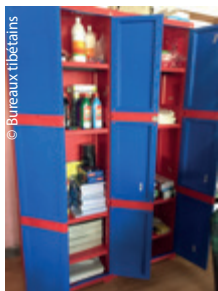
Et parmi le petit matériel offert à la Ngoenga School, ces jolies armoires propres à égayer salles de classe et d'activités.