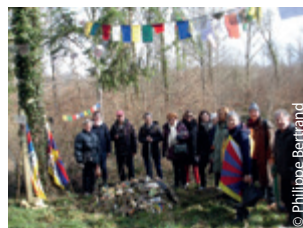
Un 10 mars champêtre dans l'Aube, en 2016.