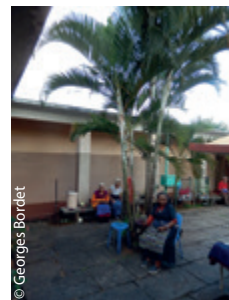
En Inde du Sud, de riches monastères assurent la transmission.