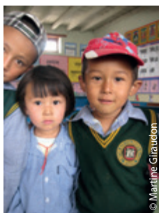
Nous, les Tibétains, on en a marre aussi, du confinement !

Nombre de parrains ont lu ou écouté les messages de soutien du Dalai-Lama. Pour ce qui est de l'Administration Centrale Tibétaine, le Président Lobsang Sangay a pris soin de diffuser aux associations un message rassurant début avril et son gouvernement a pris toutes les mesures d'aide possibles, en faveur des Tibétains appauvris, des personnes âgées ou d'un enseignement à distance. La réouverture des écoles tibétaines est prévue le 5 juin , après la célébration de Saka Dawa.