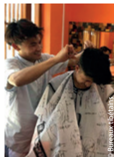
Coupe de cheveux à TCV Chauontra juste avant le confinement.