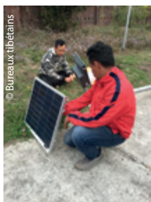
Grâce à l'AET, 12 panneaux solaires tout neufs sur le cam- pus de la Ngoenga School !