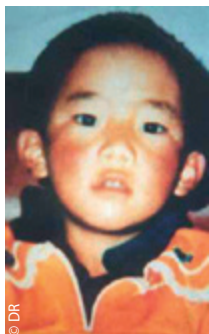
Le 11 e Panchen Lama, 31 ans s'il est toujours de ce monde.