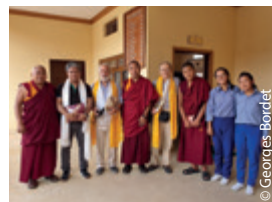
Retrouvailles au monastère de Séra-Je.