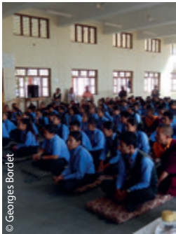
© Georges Bordet Assemblée d'élèves à Kollegal.