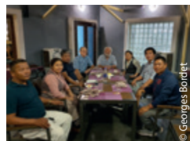
Le repas avec la Welfare Officer et d'autres responsables.